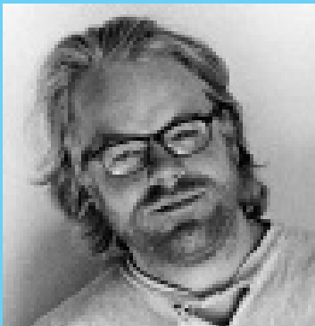
Philip Seymour Hoffman (Jago)

und Gefängnisse zu (über)füllen, zu überprüfen, neu zu denken und hoffentlich zu entschärfen. Shakespeares um 1603 entstandenes Stück ist noch immer ein provokanter Spiegel. Der Krieg im Nahen Osten ist nach wie vor eine globale Krise, eine nationale, manipulative Ablenkung und überraschenderweise auch die Chance für die Führer einer neuen Generation.