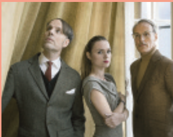
PRAG zu dritt 24.3.2022 19:30 Uhr