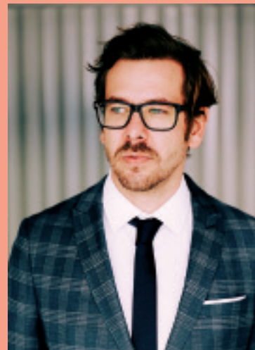
LEMO Akustik-Tour 30.3.2022 19:30 Uhr