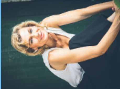
Ulrich Tukur & Die Rhythmus Boys Rhythmus in Dosen 26. | 27.3.2022 19:30 Uhr