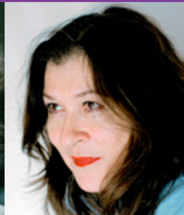
Eva Mattes mit Ensemble ZwischenWelten

Weilling Land und Leute 16.2.2024 19:30 Uhr