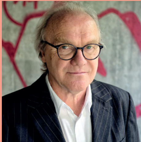
wean hean – Das Wienerliedfestival Sagen aus Wien mit Michael Köhlmeier und dem wean hean Orchester 26.4.2026 11.00 Uhr