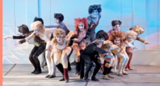
Cats der Broadway Connction erobern das Podium