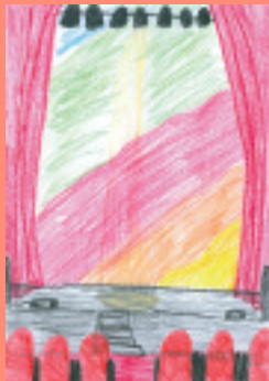
Timo Tatzber 10 Jahre